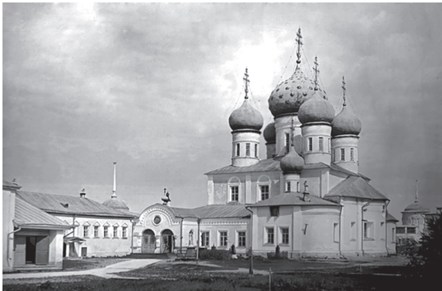
Ил. 2. Троицкий собор Калязинского монастыря. Слева от собора находится паперть с небольшим куполом, где был в 1653 году погребен митрополит Серапион. Фото 1900 г.

Надъ гробницею его, устроенною изъ бѣлаго камня, возвышается на колоннахъ деревянный, вызолоченный балдахинъ, на которомъ вверху представлены: митра, крестъ, посохъ, трикирій и дикирій. А съ правой стороны виситъ портретъ его. Святитель изображенъ здѣсь во весь ростъ въ полномъ архіерейскомъ облаченіи, и кромѣ лика его, который живописный, одежды и прочее вышито разными шерстями. Вышина портрета 2 арш. 12 верш., а ширина 2 арш. 7 верш. По преданію, портретъ этотъ устроенъ иждивеніемъ одного с.-петербургскаго купца, бывшаго въ болѣзни. Святитель, являсь во снѣ и объявля имя свое, повелѣлъ больному изобразить свой образъ въ такомъ видѣ, въ какомъ недужный сподобился зрѣть блаженнаго старца, и отослать изображение въ колязинъ монастырь. Оно доставлено въ обитель 1779 года черезъ колязинскаго архимандрита Стефана, бывшаго тогда въ С.Петербургѣ на очереди священнослуженія и проповѣданія Слова Божія.