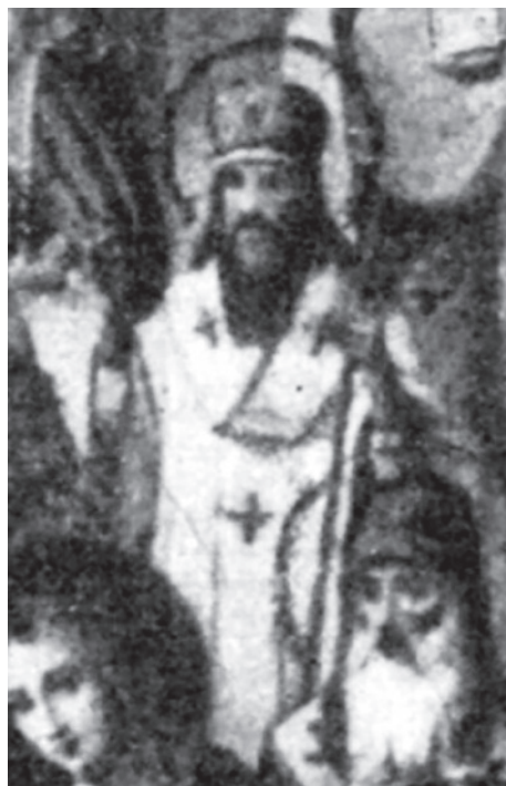
Ил. 6. Фрагмент иконы «Собор Тверских святых» с изображением святителя Серапиона.

В 1904 году архиепископ Димитрий освятил престол в честь Собора Тверских святых во втором ярусе колокольни кафедрального Спасо-Преображенского собора в Твери (ил. 7). С этого года начинается местное почитание святых, живших на территории Тверской епархии. В Соборе Тверских святых преосвященным Димитрием упомянут и сам митрополит Сарский и Подонский Серапион, и его родители: иерей Савва и Стефанида (в монашестве Филонида) [13].