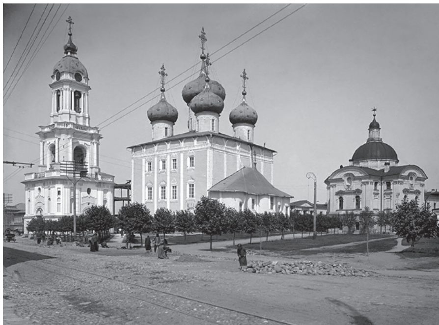
Ил. 7. Кафедральный Спасо-Преображенский собор, г. Тверь. Фото 1903 г. Разрушен в 1935 г. В настоящее время восстановлен.