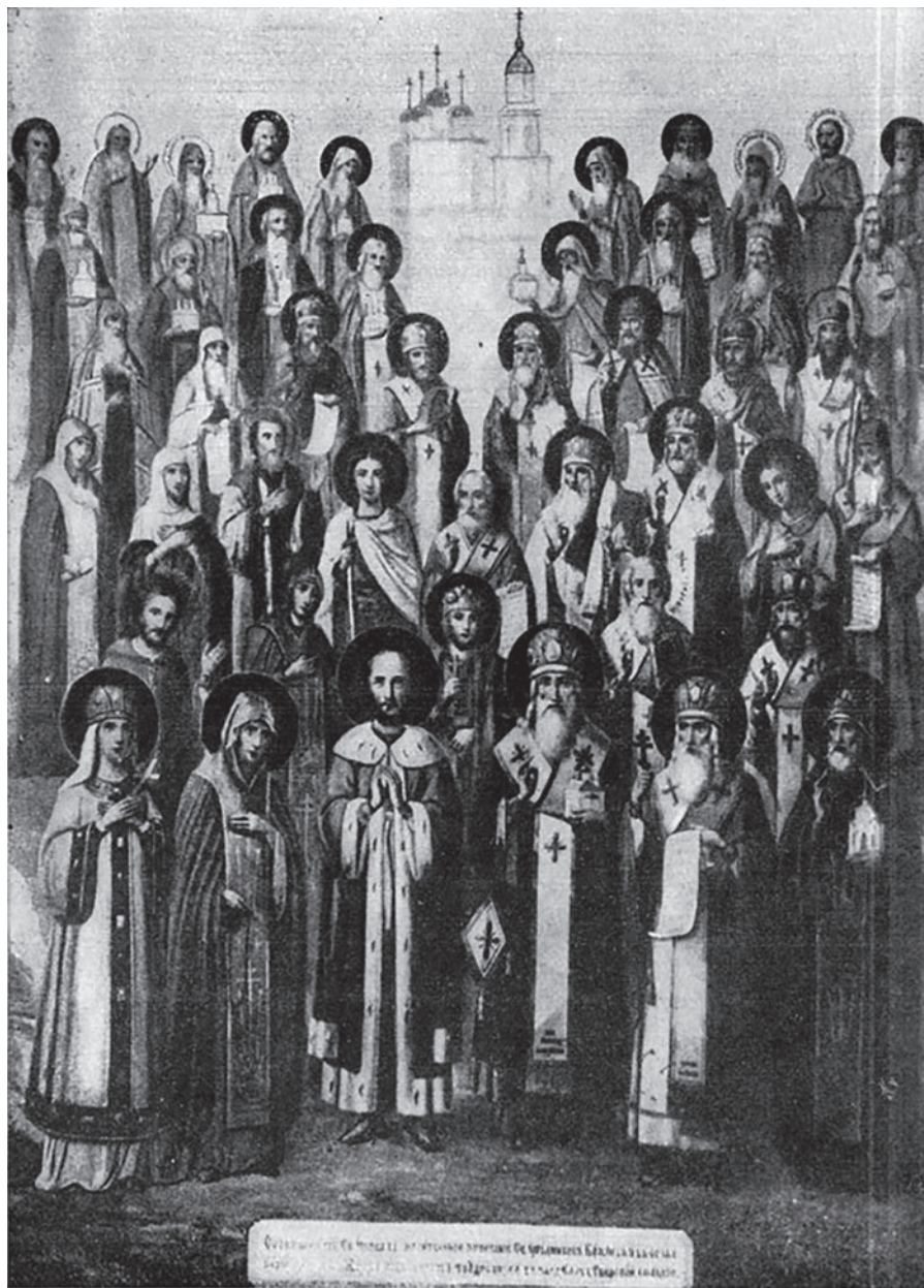
Ил. 5. Икона «Собор Тверских святых». Святитель Серапион изображен в четвертом ряду справа. Написана в Твери в 1902 г. Устроена Иоасафом Яковлевичем Кункиным, потомственным почетным гражданином г. Кашина. Находилась в Троицком храме г. Кашина. В настоящее время утрачена. Иллюстрация взята из книги «Тверский патерикъ». Казань, 1908.

Собирание сведений о Тверских святых было начато по благословению преосвященного Димитрия в 1897 году. Он составил службу всем Тверским святым и подготовил к печати Тверской