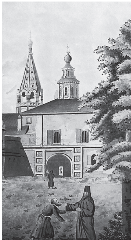
Ил. 1. Надбратная церковь Рождества Пресвятой Богородицы Спасо-Андроникова монастыря. Фрагмент акварели Франческо Кампорези. 1780–1790-е гг.

В 1634 году царь Михаил Федорович Романов распоряжается в « поминъ души » представившего своего отца патриарха Филарета выделить денежные средства на обновление надвратной церкви Рождества Пресвятой Богородицы Спасо-Андроникова монастыря [7] (ил. 1).