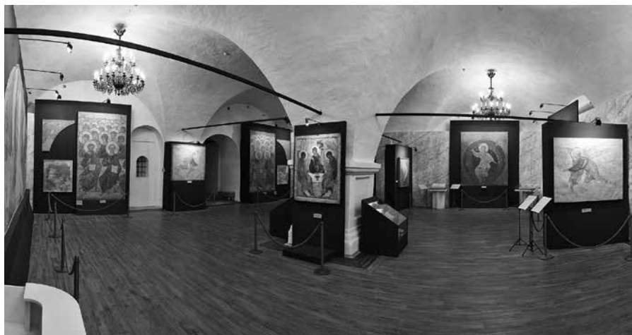
Ил. 12. Интерьер трапезной палаты Спасо-Андроникова монастыря. Выставка «Фрески Андрея Рублева». 2010 г. Центральный музей древнерусской культуры и искусства имени Андрея Рублева

же располагались другие хозяйственные помещения: квасоварня, хлебная, различные кладовые. На втором этаже также могли находиться келарская и жилые покои.