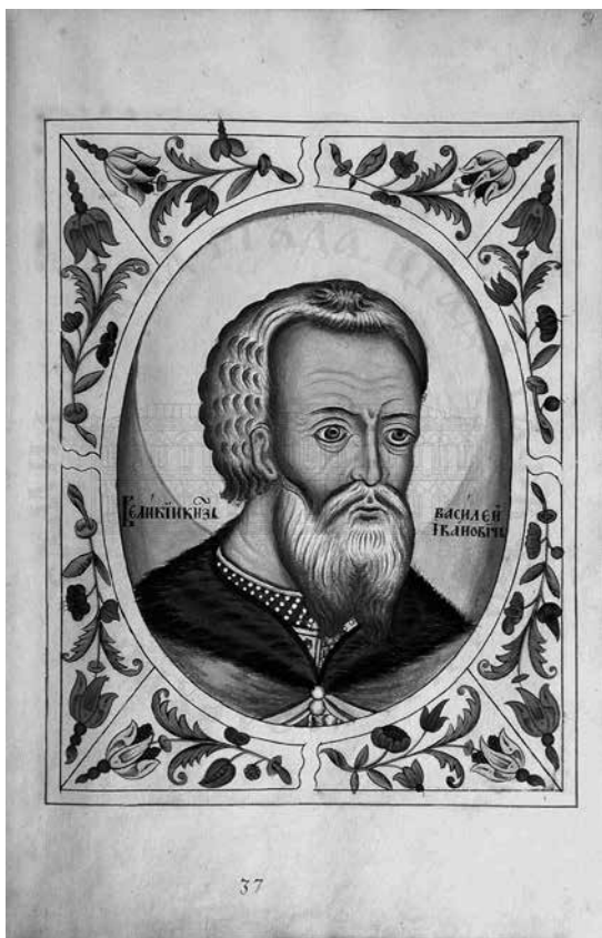
Ил. 2. Великий князь Московский Василий III. Портрет из «Царского титулярника». 1672 г.

Следующее упоминание об архимандрите Митрофане связано с его строительной деятельностью в Андрониковом монастыре. 16 мая 1504 года, в день Вознесения Господня, была заложена трапезная в Андрониковом монастыре, о чем есть сведения в Лицевом летописном своде XVI века (ил. 3).