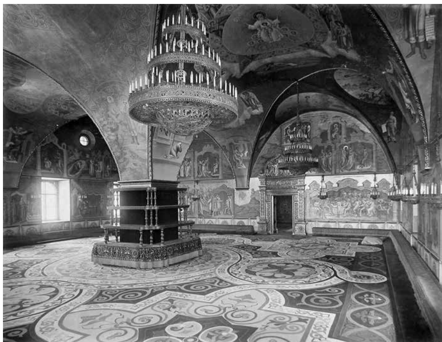
Ил. 9. Интерьер Грановитой палаты (построена в 1487–1491 гг. итальянскими архитекторами Марком Фрязиным и Пьетро Антонио Солари). Фото 1896 г.

Андроников монастырь при постройке каменных зданий имел выгодное расположение, поскольку вблизи его, в Калитникове, еще строителем кремлевского Успенского собора Аристотелем Фиораванти до начала возведения собора в 1475 году была поставлена печь для изготовления кирпича.