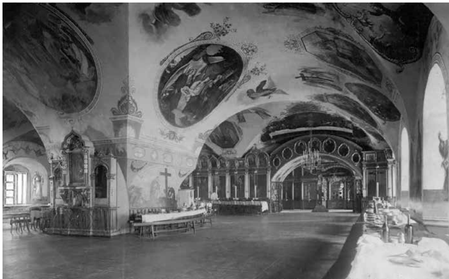
Ил. 10. Трапезная палата Спасо-Преображенского Соловецкого монастыря. Фото 1892 г.

В то время под влиянием приглашенных итальянских зодчих во многих российских монастырях строятся трапезные палаты по подобию кремлевской Грановитой палаты (ил. 9). Появление в XV веке самостоятельного архитектурного типа одностолпной палаты после введения в монастырях общежительного устава было вызвано необходимостью создания обширного пространства – для совместной трапезы, духовного единения монастырской общины (во время трапезы по обычаю читались поучения святых отцов). Для решения церковных и хозяйственных вопросов, для выбора настоятелей созывался общий собор всей монастырской братии, который также мог проходить в трапезной палате.