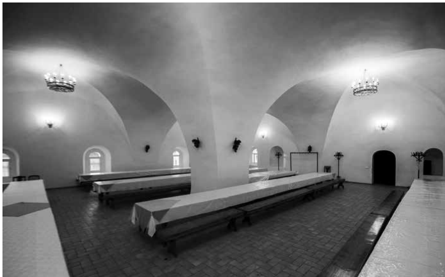
Ил. 11. Трапезная палата Рождества Богородицы Свято-Пафнутиева Боровского монастыря. Фото 2013 г.

мися на центральный столп. К основному объему трапезной, как правило, с востока примыкали келарская и церковь без апсид, образующие единый компактный объем с прямоугольным планом. Примером тому служат трапезные палаты в Троице-Сергиевом (1469), Симоновом (1487), Спасо-Андрониковом (1504–1506), Иосифо-Волоцком (1504), Пафнутьево-Боровском (1511), Кирилло-Белозерском (1519), Борисоглебском Ростовском (1524–1526), Макарьевом в Калязине (1525–1530), Ферапонтовом (1530–1534), Спасо-Преображенском в Ярославле (1-я треть XVI века), Соловецком (1551–1552), Покровском в Суздале (1553), Успенском в Свяжске (1557) монастырях. Во всех перечисленных монастырях одновременно строились, обычно с восточной стороны, и примыкающие к трапезным палатам храмы.