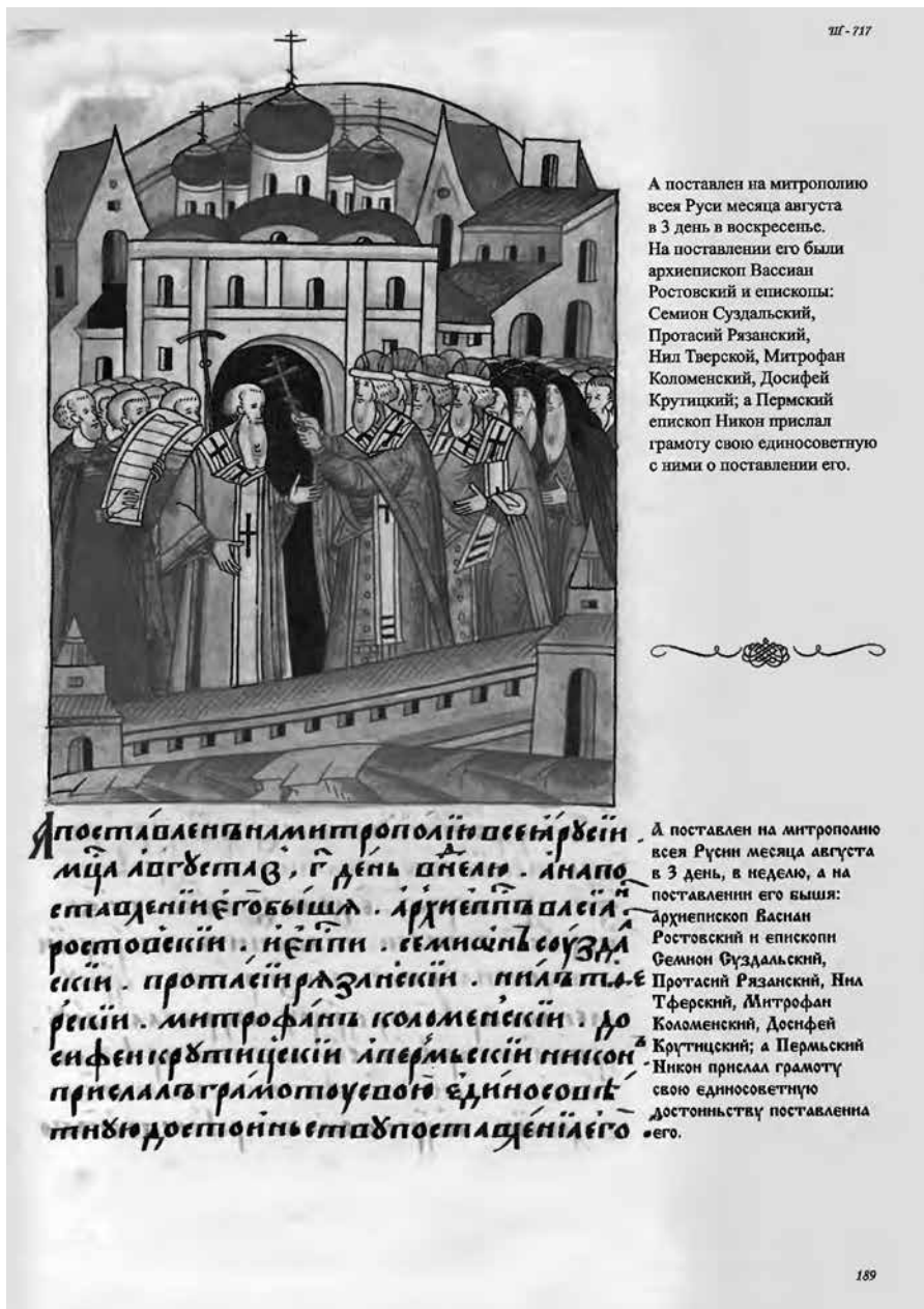
Ил. 8. Поставление архимандрита Симоновского

3 августа 1511 года влиятельный Коломенский епископ присутствовал вместе с другими владыками при поставлении архимандрита Симоновского Варлаама в Митрополиты Всея Руси. (ил. 8).