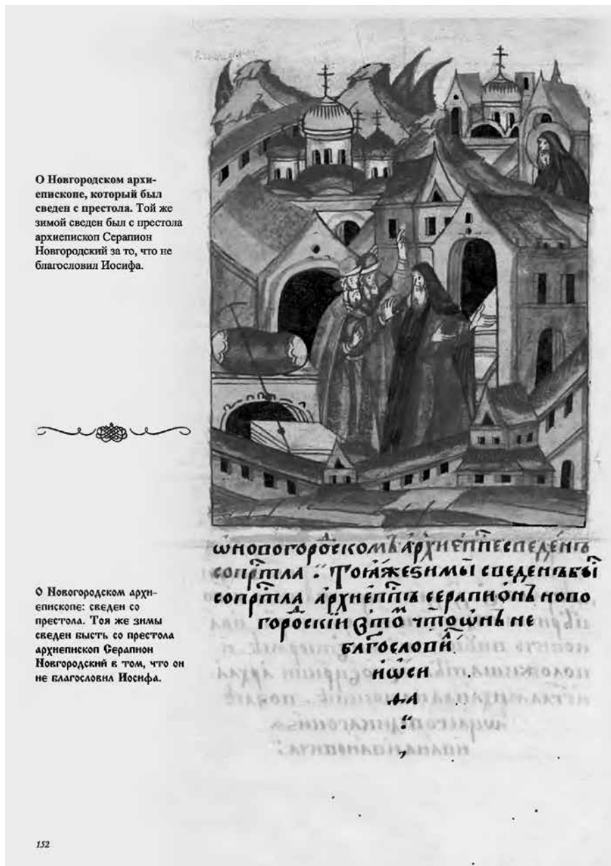
Ил. 7. Новгородский архиепископ был сведен с престола

В том же 1510 году в Москве он участвовал в заседаниях собора, осудившего Новгородского архиепископа Серапиона за распрю его с игуменом Иосифом Волоцким. Серапион был осужден, уволен от управления епархией и сослан в тяжкое заточение в Андроников монастырь (ил. 7).